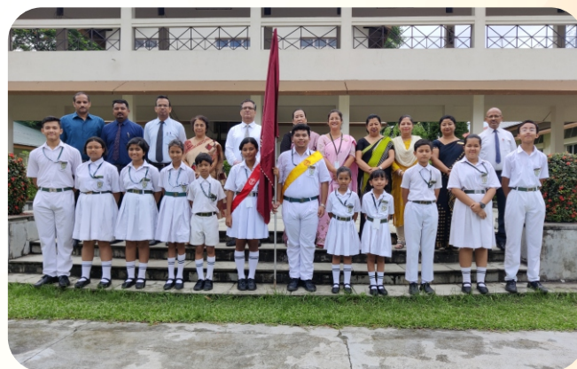
HOUSE PREFECTS - DIKHOW