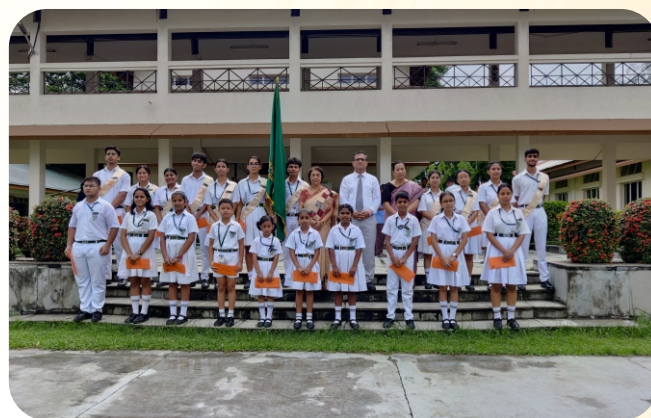
SCHOOL PREFECTORIAL BOARD