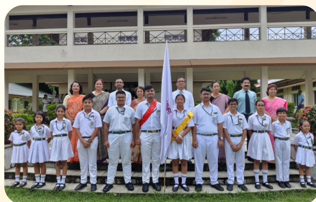
HOUSE PREFECTS - DHANSIRI