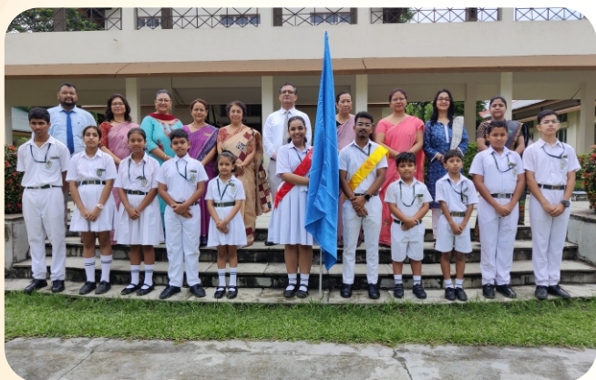
HOUSE PREFECTS - LUIT