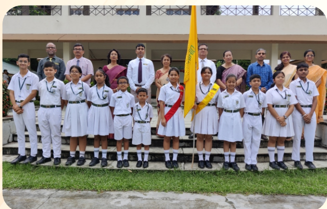
HOUSE PREFECTS - DIHING